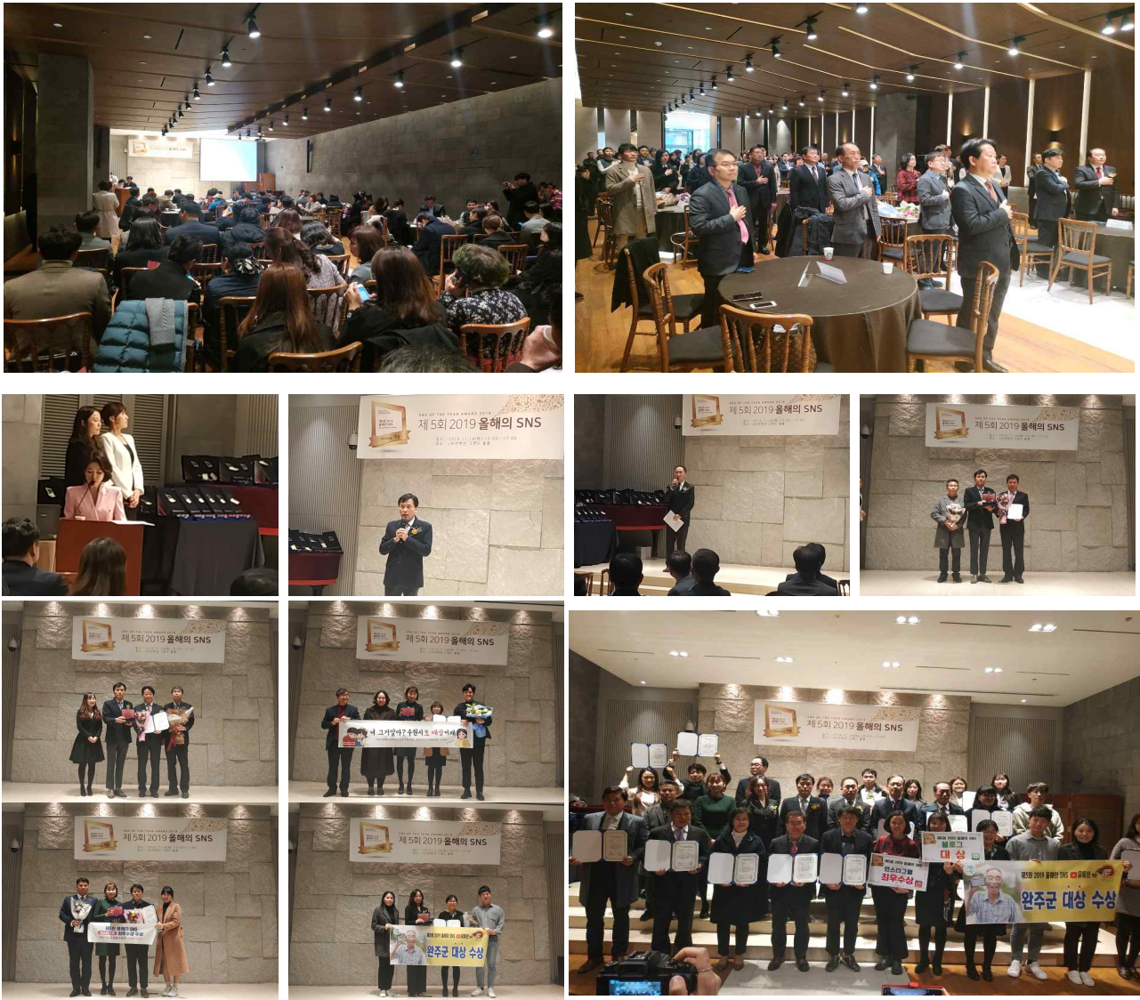
2019년 올해의 SNS 시상식 전경