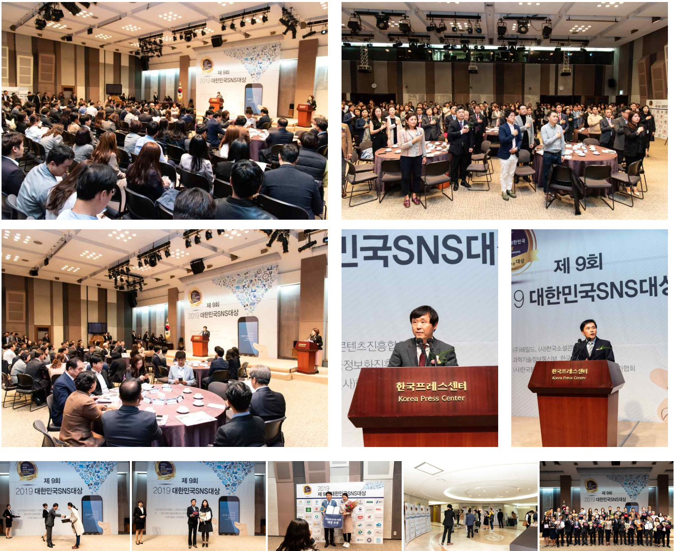
2019년 대한민국 SNS대상 시상식 전경

❖ 당 협회는 평생교육시설로써 소셜콘텐츠백서 발간, SNS 활용교육, 업계 동향 세미나 등을 꾸준히 개최하여 대·중소기업 및 소상공인의 생산성향상에 이바지할 수 있는 전문인력을 육성하고자 차별화된 교육 및 컨설팅 사업을 실시하고 있습니다. 특히 지난 2011년 제정된 대한민국 SNS대상은(snsawards.com) 조직에서 고객들과 소통하기 위하여 SNS를 잘 활용하고 있는 기업과 공공기관을 시상함으로써, 온라인 홍보부문의 경쟁력을 확보시키고, 개선에 대한 지속적인 동기부여를 하고 있습니다.